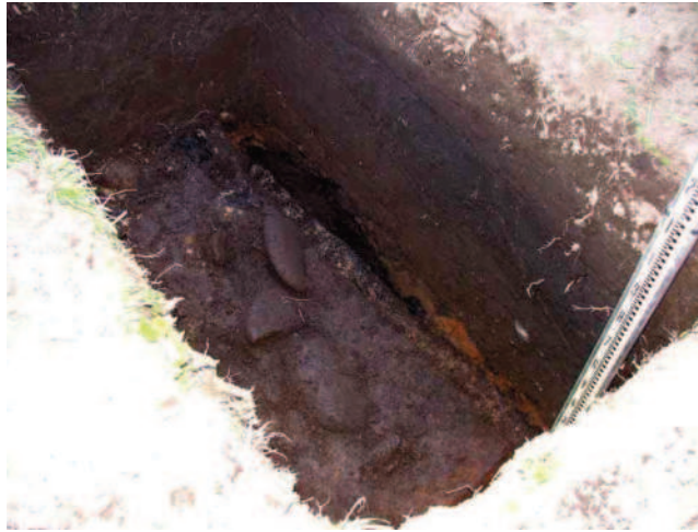
住居跡出土状況(利尻富士町役場遺跡)